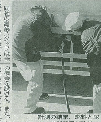
計測の結果、燃料と尿素水の消費量が改善

強化段ボール製の11型を14型パレット（1100mm×1100mm）に載せることで、積載面を14型（1400mm×1100mm）のサイズに拡張できる。11型パレットに収まらない貨物を取り扱う場合、便利で、重量物にも利用可能。省スペースで保管が可能。サイズは1枚タイプが1400mm×1100mm、折り畳みタイプが83mm×1100mm×86mmで、本体質量はそれぞれ4.3kgと5.3kg。